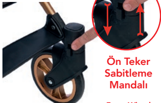
Ön Teker Sabitleme Mandalı